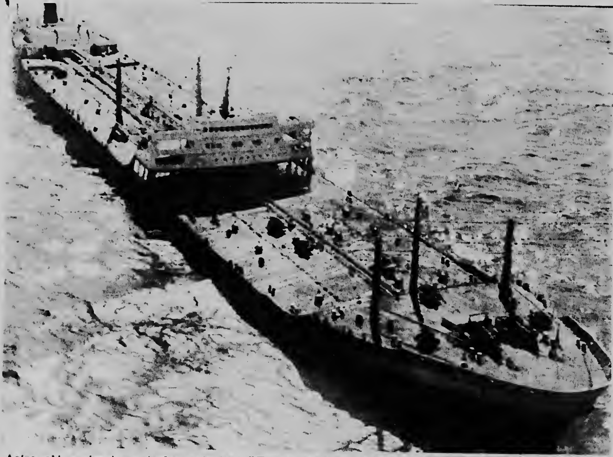
Asina aki e gigantesco tanker petrolero "Torrey Canyon" a keda meimei di Oceano Atlantico despues qu el a pega riba un barranca sumamente peligroso den oceano. Mayoría di e tripulantenan Italiano ya a ser evacuá cu helicopter pero te ainda e capitan y algun oficial ta a bordo.